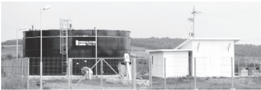
Alig vágják át a szalagot, máris elkezdődik a hálózat és a tisztítóállomás bővítését.

Az ehhez szükséges pénzüsszeget a Helyi Fejlesztések Országos Programja (PNDL) révén biztosítanák kormányalaptól, és bíznak abban, hogy közel 13 millió lejt megszerezhetnek.